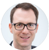
Sascha Winter Akademie der Sparkassen-Finanzgruppe Saar

06131 145-385 regine.schreiter@sv-rlp.de