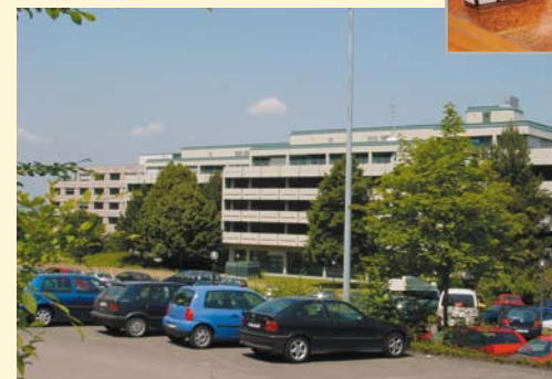
Wohnen in Neuhausen

Mit ca. 60.000 Übernachtungen pro Jahr zählt die Sparkassenakademie Baden-Württemberg zu den größten Beherbergungsbetrieben des Landes.