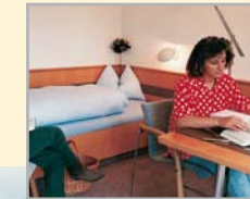
Wohnen in Rastatt