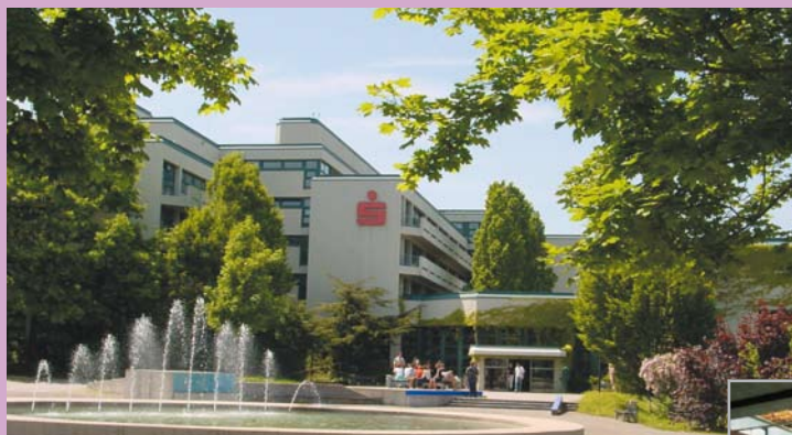
Die Akademie in Neuhausen

Tagungen sowie 50 Lehr- und Studiengänge durch. Wir erreichen damit ca. 20.000 Teilnehmer pro Jahr, die an ca. 100.000 Teilnehmertagen unterrichtet und trainiert werden.